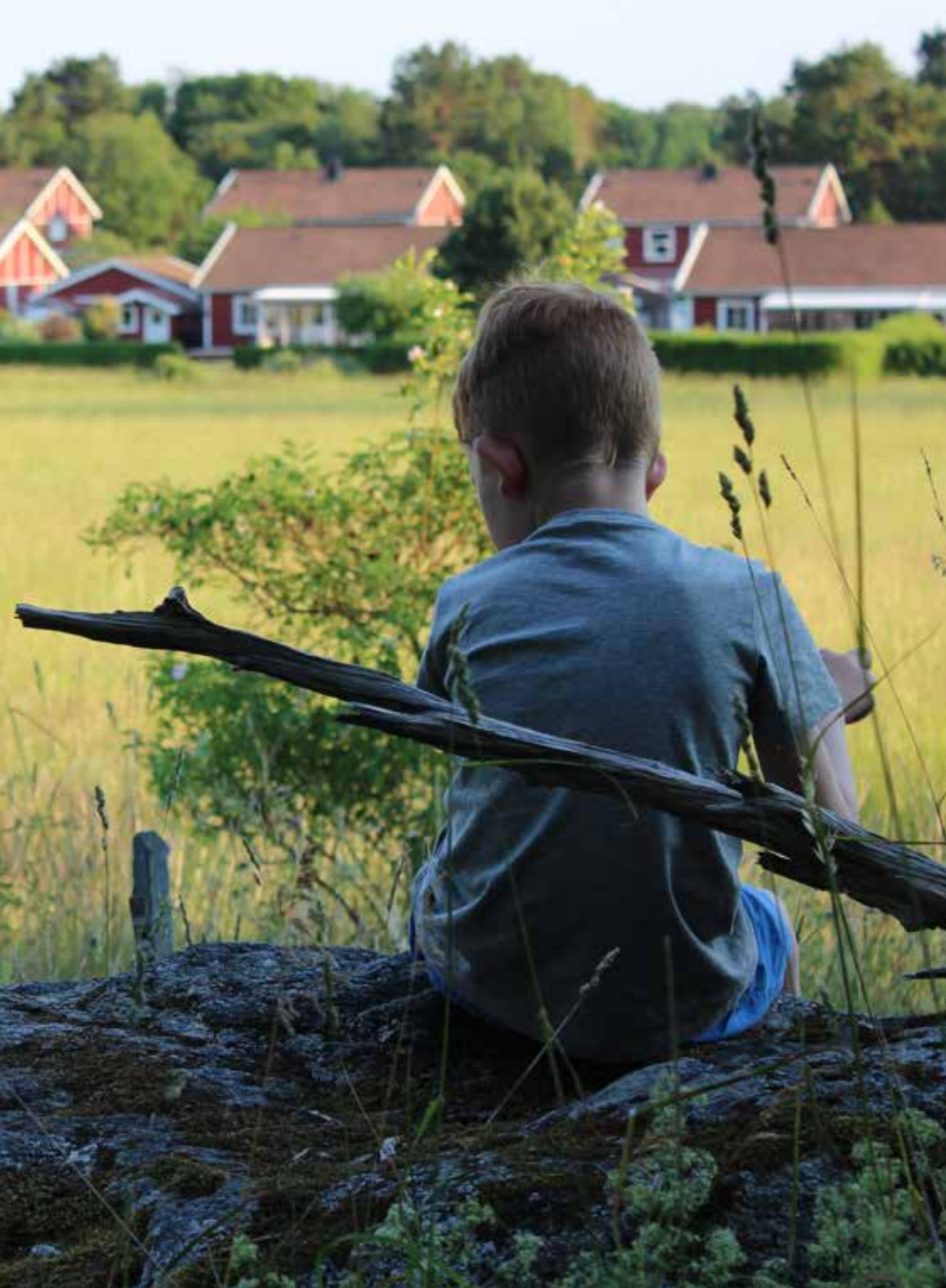
Bamseskogen intill Broby backar.