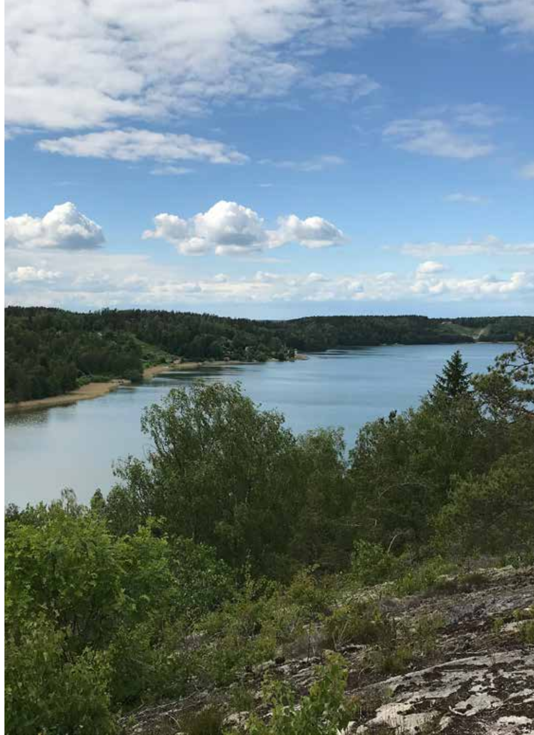
Utsikt över Lilla Ullfjärden och Gransen.